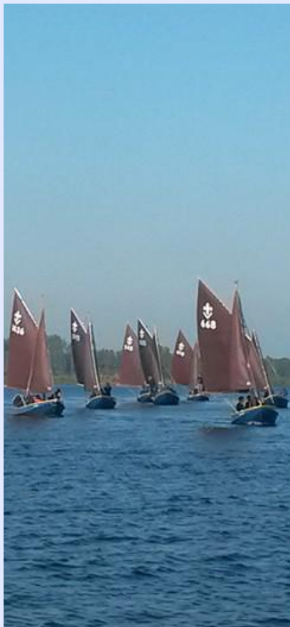
foto: de vletten van Hillegom en Sassenheim in formatie tijdens het "Admiraalzailen"